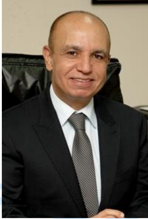
الأستاذ الدكتور أحمد مجدوبة

نائب الرئيس لشؤون الكليات الإنسانية - الجامعة الأردنية