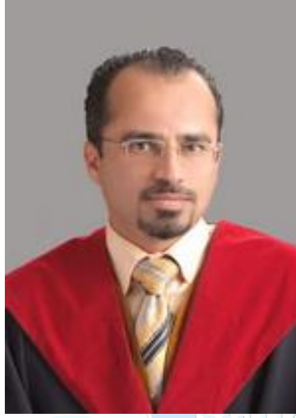
الأستاذ الدكتور فالح السواعير عميد البحث العلمي - الجامعة الأردنية

عميد البحث العلمي وأستاذ في كلية طب الأسنان في الجامعة الأردنية واستشاري أول في علم أمراض الفم في مستشفى الجامعة الأردنية، عمل كمدير لمركز الاعتماد وضمان الجودة في الجامعة الأردنية لمدة خمس سنوات 2014-2019. ألف ما يزيد عن تسعين بحث في مجال تخصصه وهو مصنف في قائمة أفضل باحثي الجامعة الأردنية وقائمة الباحثين الأكثر استشهاداً في الأردن. أنشأ نظام الجودة الداخلي في الجامعة الأردنية، وألف: "ضمان الجودة الأكاديمية في الجامعة الأردنية : دليل عملي"، كما يتمتع بخبرة كبيرة في التصنيفات العالمية للجامعات وآليات العمل على تحسينها.